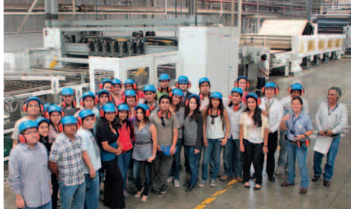
Visita a la planta de Trupal.

Entre el 17 y 18 de noviembre se realizó la 1.ª Feria Laboral 2011, donde los alumnos pudieron contactarse con las principales empresas del país y conocer más acerca de los procesos de selección de profesionales. Esta primera feria convocó a un selecto grupo de empresas nacionales y transnacionales, líderes en sus sectores, las que instalaron sus stands y brindaron información de interés. Adicionalmente, se dictaron conferencias sobre procesos de selección, tipos de evaluaciones de talento humano, perfil del empleado, etc. Participaron en esta feria, entre otras, las siguientes empresas: Movistar, IBM, HP, Alicorp, Procter & Gamble, Banco Central de Reserva del Perú, BanBif, La Positiva Vida, Deloitte, Nextel, Siemens y Edelnor-Endesa.