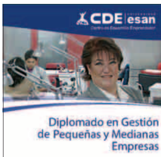
Diplomado en Gestión de Pequeñas y Medianas Empresas Inicio: 9 de febrero.