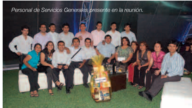
Personal de Servicios Generales presente en la reunión.