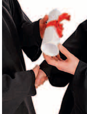
Participantes de la Maestría en Marketing.