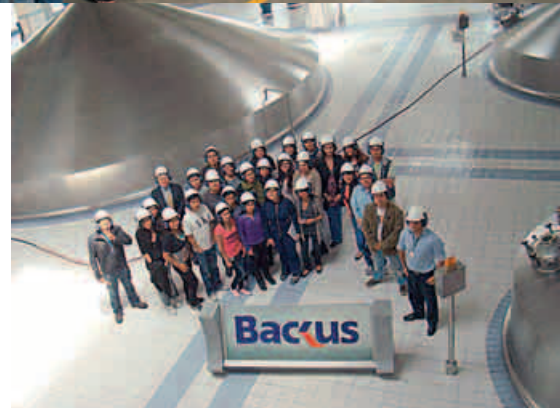
Visita a la planta de Backus.