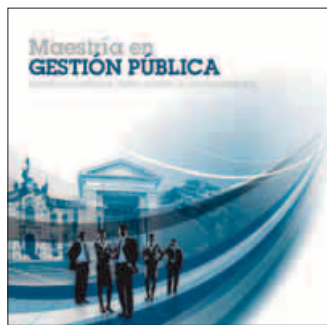
Maestría en Gestión Pública Inicio: 3 de febrero