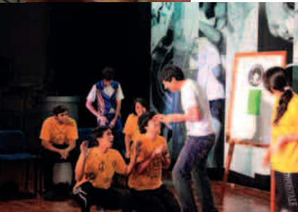
En show de Impro.