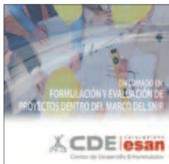
Diplomado en Formulación y Evaluación de Proyectos dentro del marco del SNIP Inicio: 31 de enero.