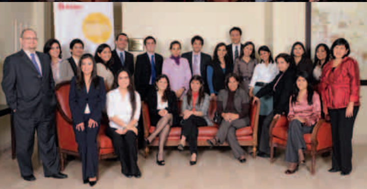
Participantes de la Maestría en Organización y Dirección de Personas.