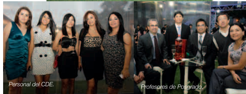
Personal del CDE.