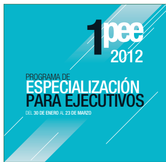
1º PEE Inicio: 30 de enero