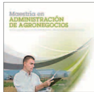
Maestría en Administración de Agronegocios Inicio: 21 de enero