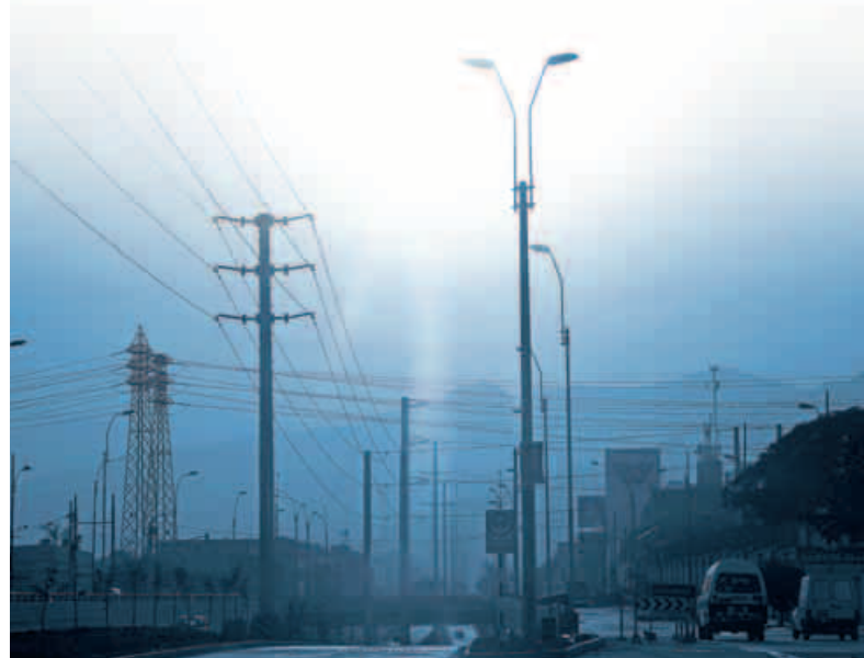
Nuestra maestría, en cambio, busca más bien desarrollar la carrera basada en materias de gestión y desarrollo de la energía en general. Por energía no referimos principalmente a la energía eléctrica, los hidrocarburos y el gas natural.

Queremos que se convierta en la referencia académica para la formación de profesionales en el sector energía en el Perú. No se trata de una maestría tecnológica, sino de una maestría que otorga herramientas para gestionar y desarrollar