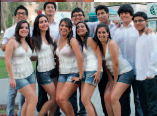
Conjunto de bailarines de bachata.