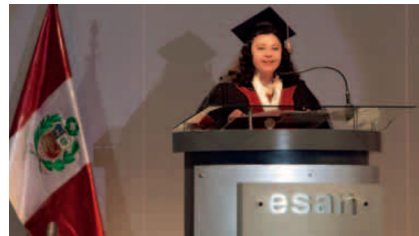
Un MBA para todo el Perú.

Para estos cambios ESAN se inspiró en los currículos de los programas MBA de Stanford, Harvard, Wharton, London Business School, HKust e Insead.