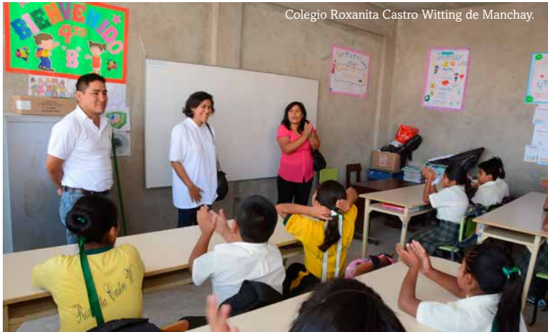
Colegio Roxanita Castro Witting de Manchay.

Una de las primeras iniciativas de “Ecoesán, vive responsable”, programa creado con el fin de desarrollar actividades de responsabilidad social, fue “Siembra tu árbol”, realizada en los exteriores del campus, junto al muro que da a la calle 6. Participaron profesores, colaboradores y alumnos para afirmar nuestra decisión de cuidar el medio ambiente y compensar el bióxido de carbono que emitimos diariamente.