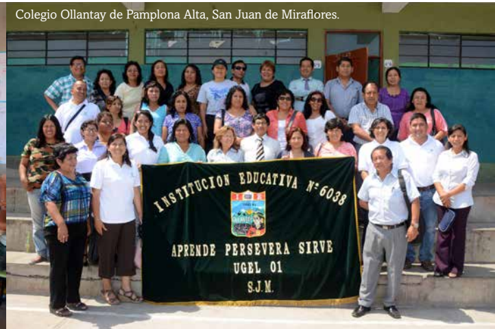
Colegio Ollantay de Pamplona Alta, San Juan de Miraflores.