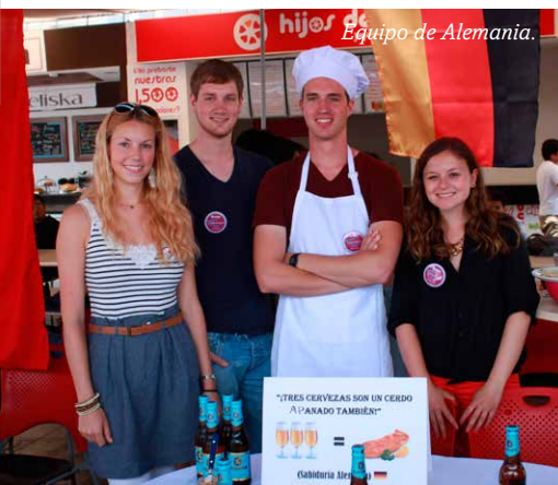
Equipo de Alemania.