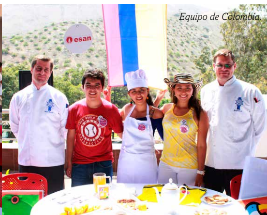
Equipo de Colombia.