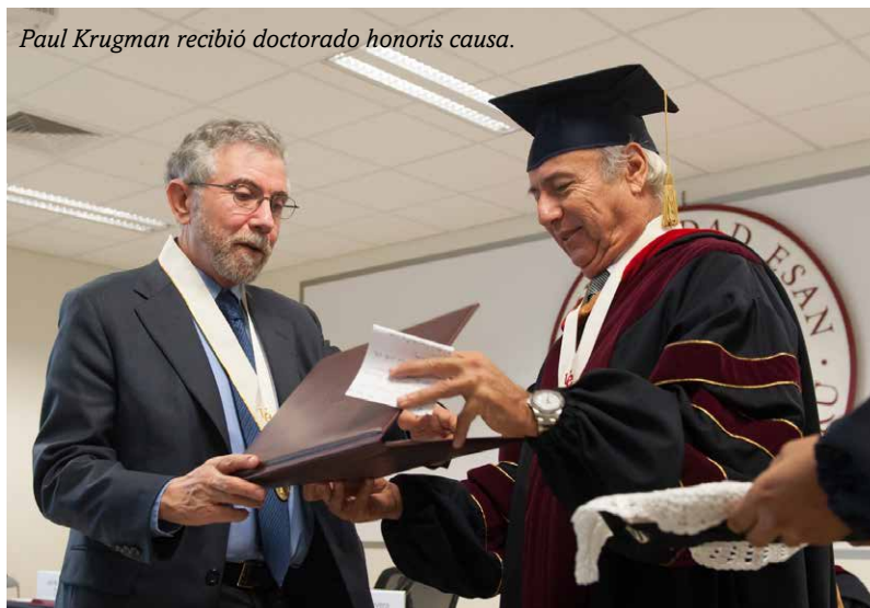
Paul Krugman recibió doctorado honoris causa.

lo suficientemente valioso como para recibir esta condecoración, y esto me hace pensar que la lucha por resolver los problemas económicos está dando resultados”.