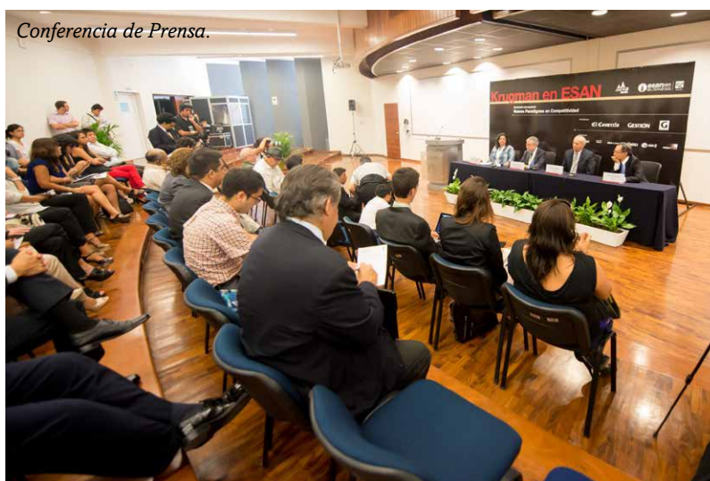
Conferencia de Prensa.

Paul Krugman expresó su agradecimiento por el honor recibido y resaltó su compromiso con la investigación y la economía mundial. “Agradezco a ESAN por este reconocimiento. Sé