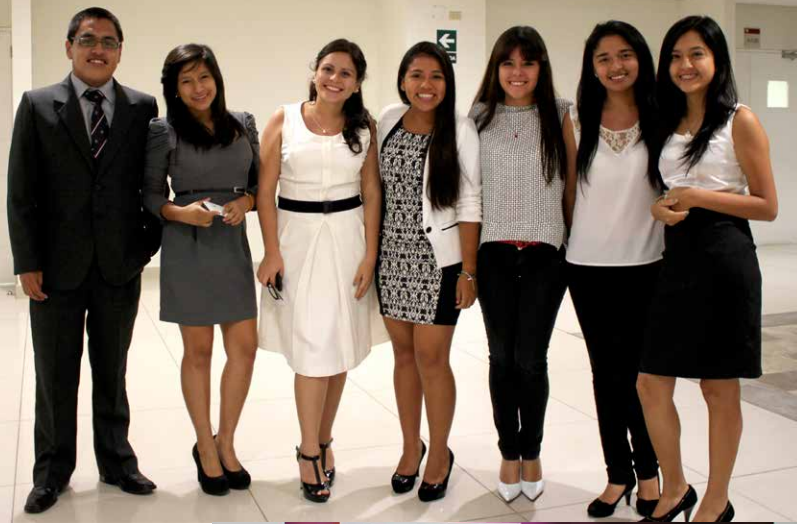
Alumnos de la carrera de Derecho Corporativo.