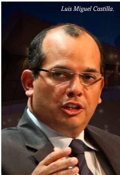
Luis Miguel Castilla.