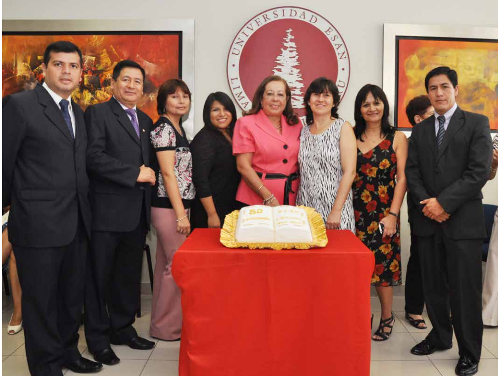
Actual equipo de ESAN/Cendoc.

Durante la ceremonia propiamente dicha, los anfitriones presentaron un video institucional que resumía la trayectoria de nuestra biblioteca y centro de información, así como una pequeña exposición de publicaciones, fotografías y otros materiales que permitían recordar todo lo vivido en este medio siglo. Llamaban la atención las diversas imágenes del personal, captadas en sus respectivos ambientes de trabajo, y las antiguas fichas de usuarios, entre las que veíamos los rostros juveniles de varios de los actuales miembros del cuerpo académico.