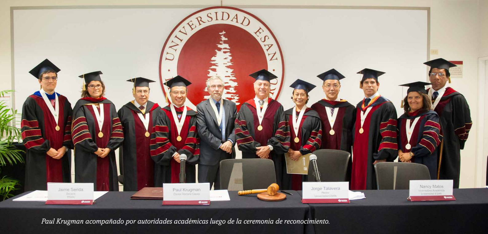
Paul Krugman acompañado por autoridades académicas luego de la ceremonia de reconocimiento.

tes y a todos aquellos que hicieron de este seminario un gran evento.