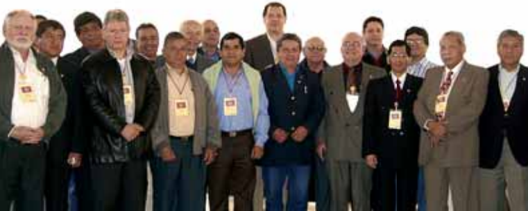
El presidente de Aeesan y miembros de la promoción 1982 de los PADE después de recibir la distinción por sus 25 años de egresados.