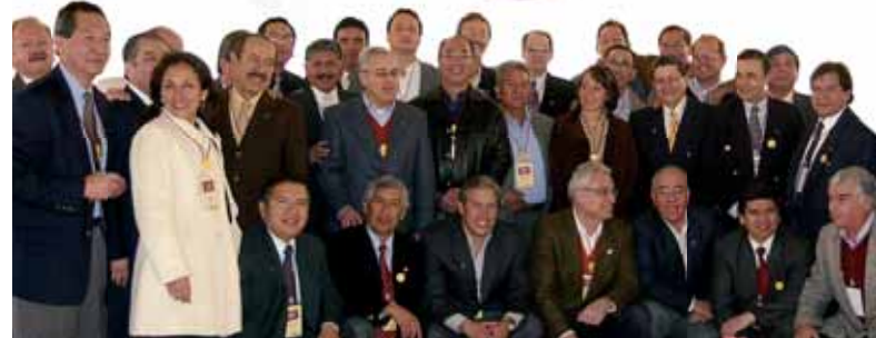
Un grupo de graduados del MBA con el presidente de Aeesan celebrando sus bodas de plata.

CONTINUANDO CON LA TRADICIÓN, el último sábado de setiembre se celebró el "Día del Reencuentro", con la participación de gran número de ex alumnos. Muy comentadas fueron las trece exposiciones a cargo de reconocidas personalidades del quehacer empresarial, los que trataron temas de financiamiento, inversión, desarrollo de nuevos negocios, marketing de consumo, ética, tributación, minería y tecnologías de información. Al mismo tiempo, se organizó una feria laboral en la que participaron: Adecco, Alicorp, Deloitte, KPMG, Laborum.com, Gargurevich & Asociados, PriceWaterHouse-Coopers, Southmark y Stanton Chase Internacional.