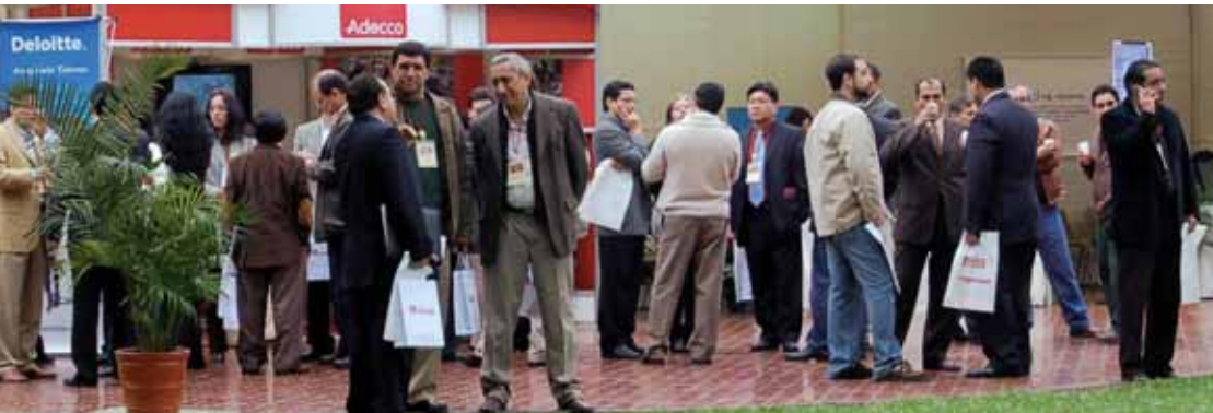
Estrategia de empleabilidad: más de 600 ex alumnos retomaron contacto con "head hunters" y actualizaron su perfil profesional.

Como siempre la diversión y alegría estuvieron presentes gracias al almuerzo de camaradería ofrecido por ESAN. La ocasión también fue propicia para distinguir a las promociones que han cumplido este año bodas de plata: los 76 graduados del MBA promoción 1982 y los 371 egresados de los PADE del mismo año. Sus integrantes, muy aplaudidos, recibieron un distintivo por parte de las organizaciones de ex alumnos y un diploma conmemorativo de ESAN.