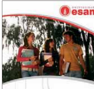
Carreras universitarias Próximo examen de admisión: 13 de julio