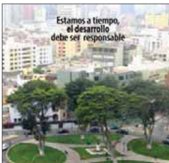
II Civis Inicio: 20 de junio