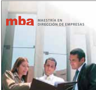
mba MAESTRÍA EN DIRECCIÓN DE EMPRESAS Piura - Inicio: 24 de mayo Cajamarca - Inicio: 7 de junio

Para mayor información acerca de nuestros programas, llámenos al 317-7226 o visítenos en www.esan.edu.pe