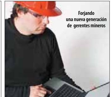
PAE en Gestión Minera Forjando una nueva generación de gerentes mineros Conferencia informativa: 27 de mayo Swissotel, 7:15 pm. Inicio: 30 de julio