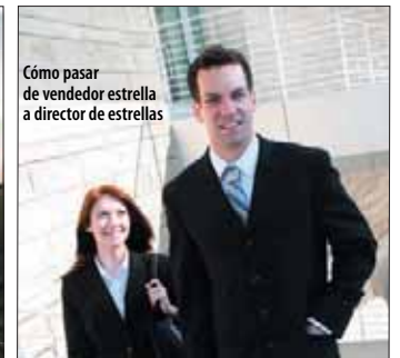
PAE en Dirección de Ventas Conferencia informativa: 29 de mayo Swissotel, 7:15 pm. Inicio: 9 de julio