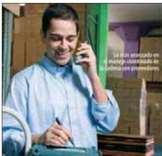
PAE Supply Chain Management Conferencia informativa: 8 de mayo Swissotel, 7:15 pm. Inicio : 2 de Julio