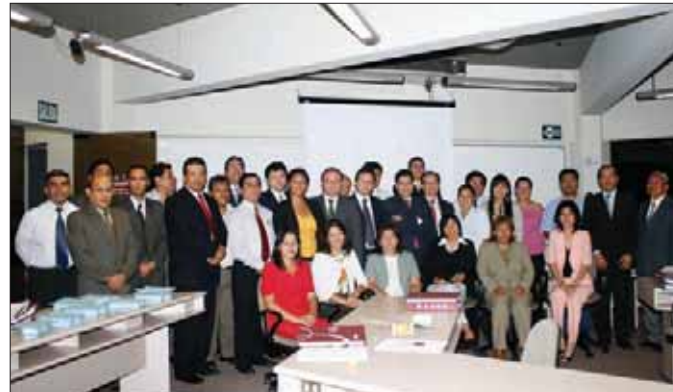
Grupo de alumnos del programa de Gestión en Hidrocarburos.

El programa consta de 184 sesiones de clases distribuidas en cuatro módulos, con una duración total de nueve meses, en los que se desarrollarán temas como Marketing de Hidrocarburos, Reingeniería de Costos y Costeo, Negociaciones Efectivas, Evaluación de Inversiones en Hidrocarburos, Contratos Petroleros, Regulación de Transporte Tarifario, entre otros. Cabe señalar que los profesores y expositores que están a cargo de este programa son especialistas nacionales y extranjeros de reconocida trayectoria en el campo de los hidrocarburos.