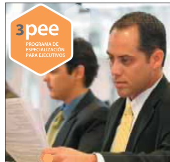
III PEE Conferencia informativa: 20 de mayo Swissotel, 7:15pm. Inicio : 2 de junio