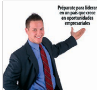
PADE de Administración Inicio: 22 de mayo