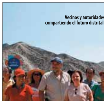
e - Civis Inicio: 27 de junio

Comité editorial: Ana María de Pareja y Rosa de Pérez-Costa. Edición: Ada Ampuero C. • Textos: Verónica Gonzáles. Fotos: Manuel Figari, Verónica Gonzales y Justo Olivera. Diseño y diagramación: Manuel Figari • Impresión: HeralMol Industria Gráfica. Informesan es una publicación de la Universidad ESAN. Alonso de Molina 1652, Surco. Casilla Postal 1846, Lima 100, Perú. www.esan.edu.pe/informesan.htm • e-mail: informesan@esan.edu.pe Telfs.: (51-1) 317-7200 Fax: (51-1) 345-1328. Depósito Legal: 983631. Queda autorizada su reproducción total o parcial siempre que se mencione la fuente.