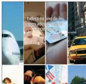
PAE Marketing de Servicios Conferencia informativa: 13 de mayo Swissotel, 7:15 pm. Inicio: 26 de junio