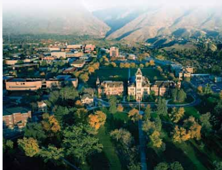
Campus de Utah State University.

La organización de esta actividad corresponde a convenios de apoyo interinstitucional que la Universidad ESAN tiene con instituciones académicas extranjeras de prestigio.