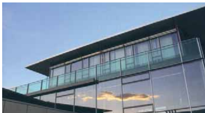
Universidad de Pforzheim.

Para obtener el doble título, los alumnos deberán participar en el Programa Internacional de Estudios de la mencionada universidad alemana durante un año, ya sea en la concentración de Marketing o en la de International Business, según la especialidad que corresponda. Este periodo formará parte de los cinco años de la carrera.