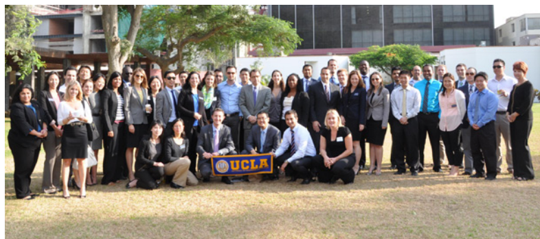
Delegación de alumnos de UCLA visita ESAN.

En total fueron 42 participantes del Executive MBA y Fully Employed MBA de las siguientes nacionalidades: Estados Unidos, Canadá, India, China, Ghana, Nigeria y otros. Fueron recibidos por el rector y luego asistieron a dos conferencias: “Energy and natural resources market: Opportunities and challenges”, a cargo del profesor Arturo Vásquez Cordano, y “Corruption in Peru: Challenge for the development of good governance”, dictada por el profesor Genaro Matute.