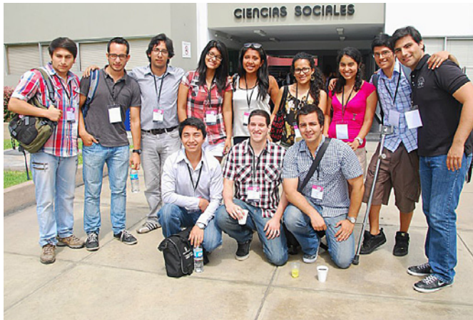
Alumnos integrantes del equipo de Debate.