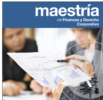
Maestría en Finanzas y Derecho Corporativo Inicio: 20 de mayo