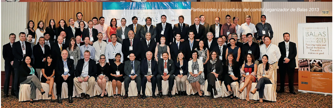
Participantes y miembros del comité organizador de Balas 2013