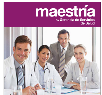
Maestría en Gerencia de Servicios de Salud Inicio: 30 de mayo