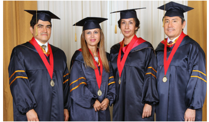
Nuevos doctorandos que pertenecen a la primera promoción de esta Maestría.

http://www.esan.edu.pe/maestrias/investigacion-en-ciencias-de-la-administracion/