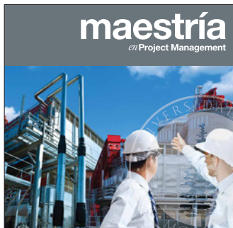
Maestría en Project Management Inicio: 28 de mayo