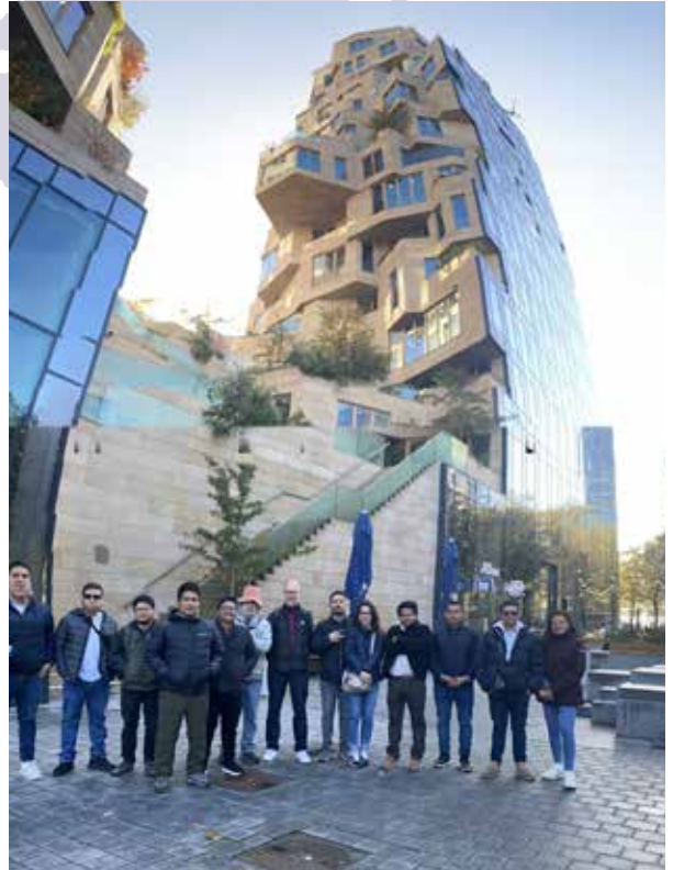
Recorrido por el distrito Zuidas, zona empresarial, residencial y comercial de Ámsterdam.