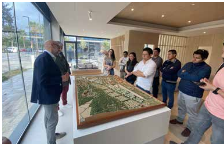
Visita al desarrollo inmobiliario en el balneario de Sitges de Vertix Grupo Inmobiliario - Barcelona.