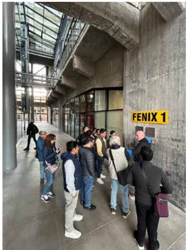
Visita al proyecto Fenix Building & Katendrecht en Rotterdam.