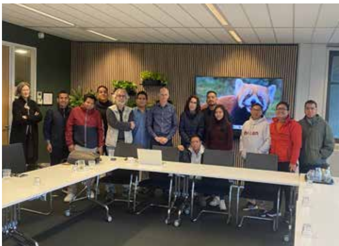
Conferencia en la Federación de Corporaciones de Vivienda Comunitaria de Ámsterdam.